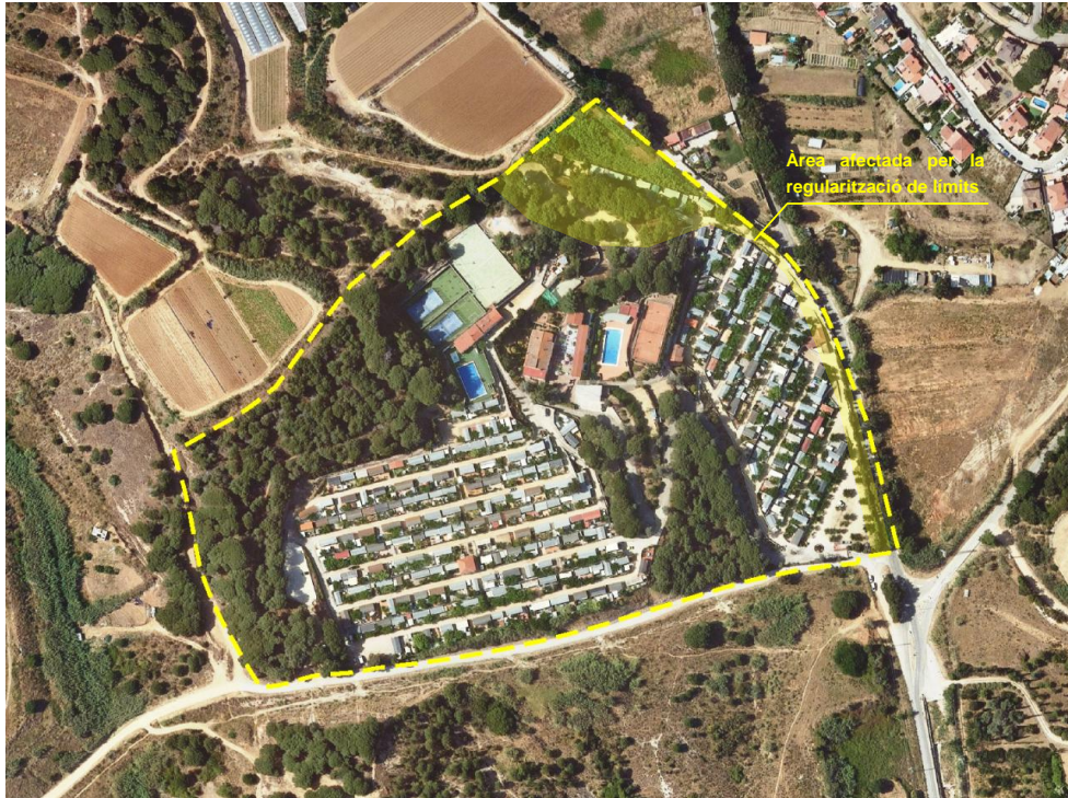
Ortofoto, àmbit del PE-34 i àrea afectada per la regularització de límits

d'urbanització. El febrer de 2022, TCM ha realitzat un aixecament topogràfic per avaluar l'impacte de l'execució d'aquesta primera fase d'urbanització. D'aquest anàlisi es constata disfuncions vinculades a la necessitat de moviment i contenció de terres (superior als 4m) i al pendent resultant de la vialitat interior (amb pendents fins el 22%).