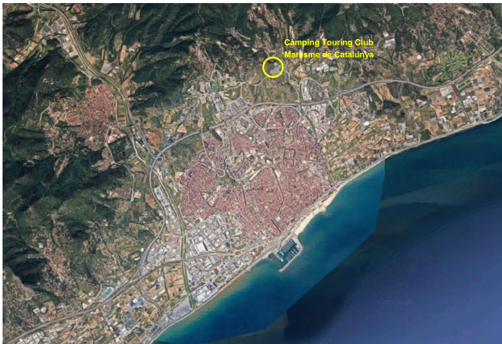
Ortofoto amb la situació.

El Camping Touring Club Maresme (TCM) se situa al nord est del municipi de Mataró, per sobre l'autopista C-32, a la cantonada entre el Camí dels Contrabandistes i l'eix que conforma la Carretera de Valdeix, la Riera de Can Bruguera i la Riera de Ca l'Ametller. El TCM té una superfície de 85.264 m 2 i 252 unitats d'acampada (UA).