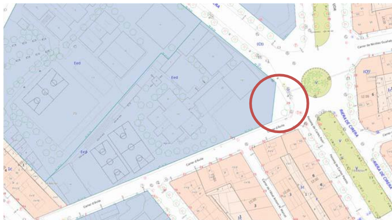
Àmbit afectació xamfrà carrer Àvila/Riera de Cirera segons planejament vigent

La Fundació GEM (Grup Escoles Mataró) titular del centre des de l'any 1966 és una entitat sense ànim de lucre de tipus docent, responsable així mateix de la gestió de l'Escola GEM. L'Escola GEM de Mataró té una oferta formativa completa de 0 a 18 anys; Llar d'infants, Educació Infantil, Primària, Secundària i Batxillerat. L'objecte d'aquest document és la d'iniciar el tràmit de participació dels ciutadans i ciutadanes abans de la realització del projecte de modificació de Pla General en relació a l'afectació d'un àmbit que urbanísticament està qualificat de Sistema de Vialitat i que es troba a l'interior dels límits de la propietat del titular.