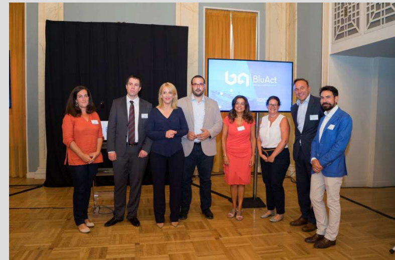
Pirmera Trobada Transnacional de les ciutats participants a Pireaus. Alcaldes i representants de la UE (28 i 29 d'agost de 2018)