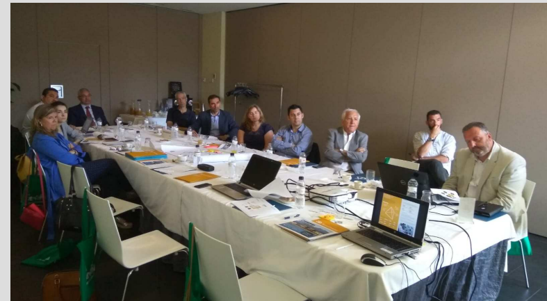
Visita d' l'expert europeu en Xarxes de transferència Jim Sims a Mataró (14 de juny de 2018)