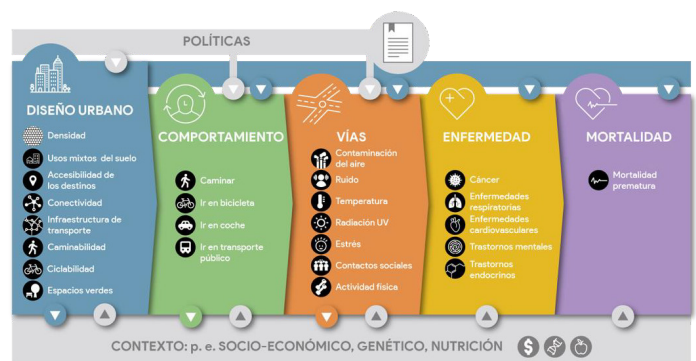
Figura 2: Marc conceptual planificació urbana i salut

La millora de les condicions dels edificis i els habitatges perquè siguin més accessibles i energèticament eficients ha passat a primer pla amb el COVID-19, juntament amb la necessitat d'un espai de qualitat per viure. Les inversions per millorar l'habitatge i salvaguardar les opcions de mobilitat pública sostenible, així com promoure la proximitat i l'ecologia de les ciutats a través de la planificació, poden proporcionar beneficis en múltiples sectors. S'ha de canviar el sistema cap a una visió més holística que tingui en compte i comptabilitzi aquestes externalitats (co-beneficis). El sistema actual per sitges no permet entendre bé els costos i beneficis de diferents escenaris.