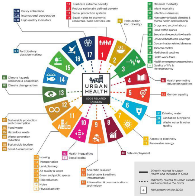
Figura 1: Objectius dels ODS relacionats amb salut urbana, ODS3+

De la mateixa manera, sabem que les ciutats accentuen les desigualtats i la inequitat. Si l'equitat no està contemplada com a component fonamental per assegurar que tant els beneficis com els riscos es reparteixen de manera justa, sempre ens quedarem curts per arribar als ODS i altres objectius. Tot i que està menys desenvolupant, hi ha eines i marcs per incorporar i avaluar l'equitat dins les polítiques i estratègies. Hi ha necessitat de més atenció a mesures que atenuïn la desigualtat i de reforçar sistemes de protecció social per als més desfavorits. Per treballar l'equitat, cal tenir dades locals a nivell de barri per poder detectar i monitorar les situacions en diferents contextos de la ciutat.